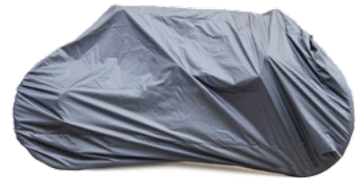
シートポスト シートクランプ