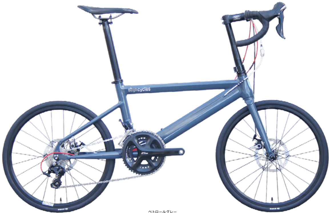
ベトロールグレー