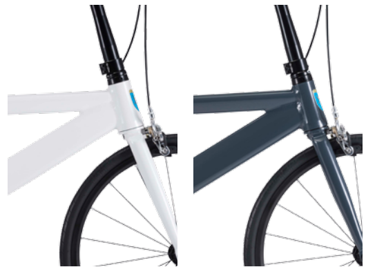
メタリックフレックホワイト